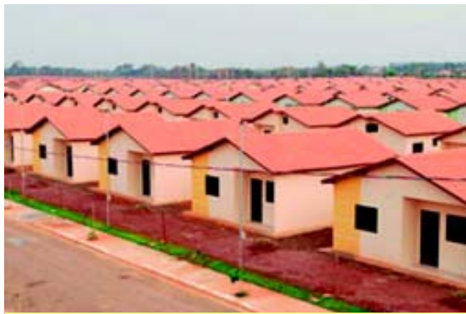
| Casa própria: sonho realizado através do FGTS

Segundo dados da GEPAS (Gerência Nacional de Passivo do FGTS), o Fundo de Garantia tem um patrimônio de R$ 276,3 bilhões, um patrimônio líquido de R$ 35,9 bilhões e uma carteira de R$ 120,8 bilhões em operações de crédito. A expectativa para 2011 é que a arrecadação bruta alcance a cifra de