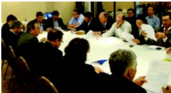
Dissídio: a ADVOCEF e a CONTEC na mesa de negociação

O presidente da ADVOCEF avalia que houve avanço na negociação, pois a Empresa, antes, se negava a discutir as questões dos profissionais. A qualidade dos trabalhos apresentados pela ADVOCEF e