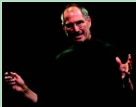
| Steve Jobs

Frase que circula na internet, proferida por anônimo americano: "Há 30 anos tínhamos o Jobs, o Johny Cash e o Bob Hope. Agora, no Jobs, no Cash, no Hope".