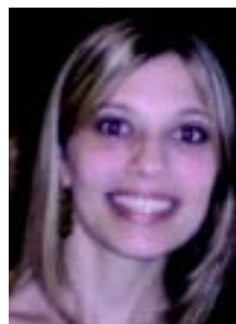
Anelise: as evoluções tecnológicas

O advogado se refere a salas de aula lotadas, baixa remuneração e falta de incentivo à qualificação - um problema de décadas. Menciona um estudo recente da Universidade