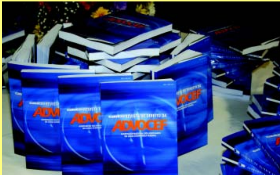
| A publicação da ADVOCEF está no Qualis, atestado de qualidade