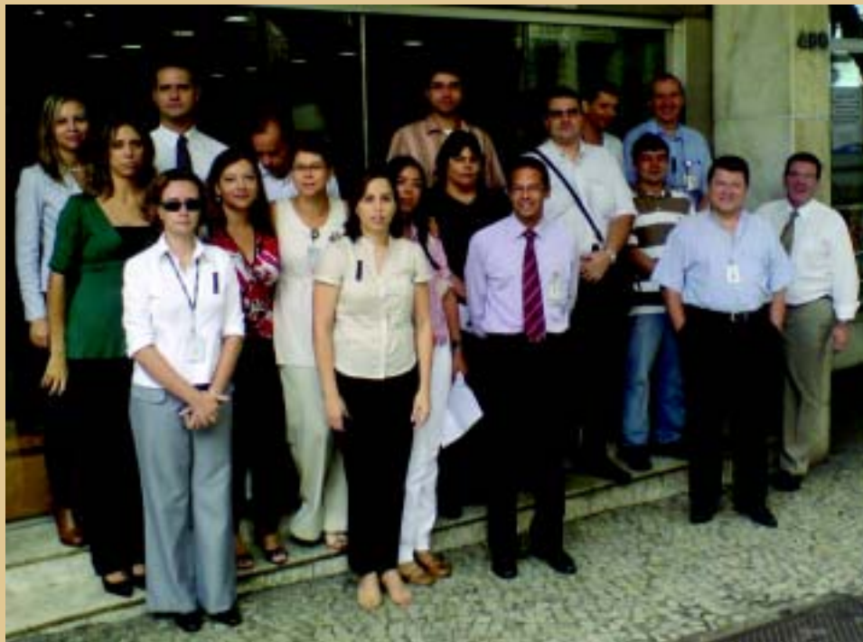
Belo Horizonte: a greve assustou os sindicatos

"Hoje podemos ter certeza de que não mais será assim, pois o slogan do nosso movimento foi absorvido por nossas consciências e não há mais como se pensar nos advogados sem que nos