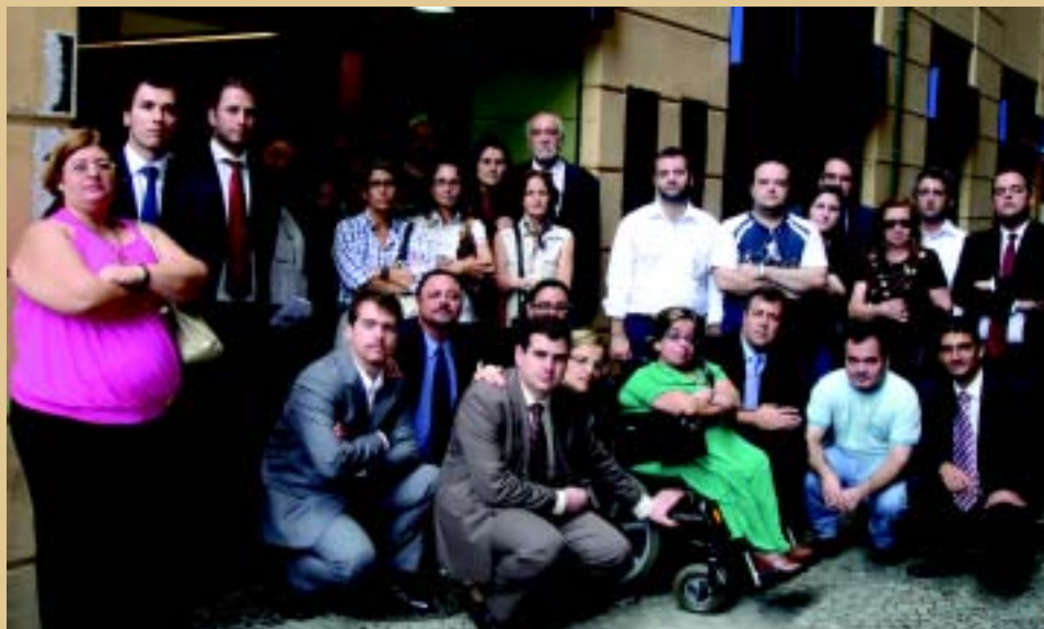
Rio de Janeiro: senso de coletividade e justiça