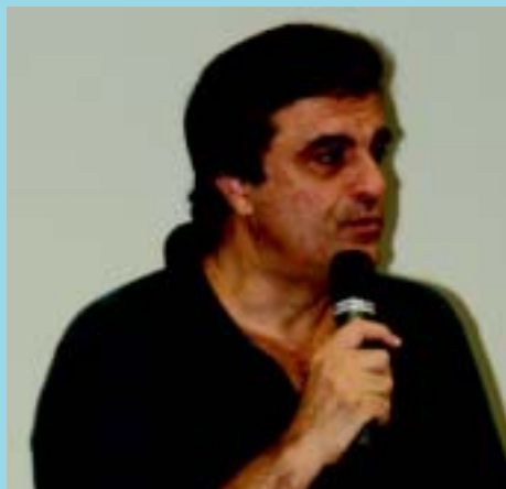
| Deputado José Eduardo Cardozo