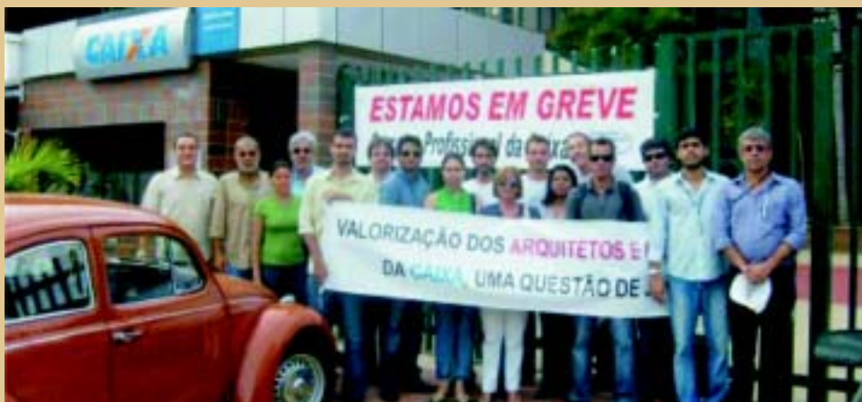
Salvador: 100% de adesão, menos um

Na Bahia, em todas as unidades, em Salvador, Ilhéus e Feira de Santana, foi