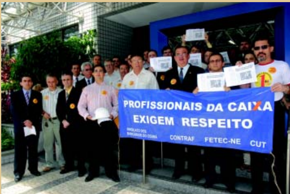
Fortaleza: integração total entre os profissionais

obtida a adesão de 100% dos advogados sem função. "Infelizmente, após o sétimo dia tivemos uma baixa, mas não influenciou os demais que permanecem unidos até hoje."