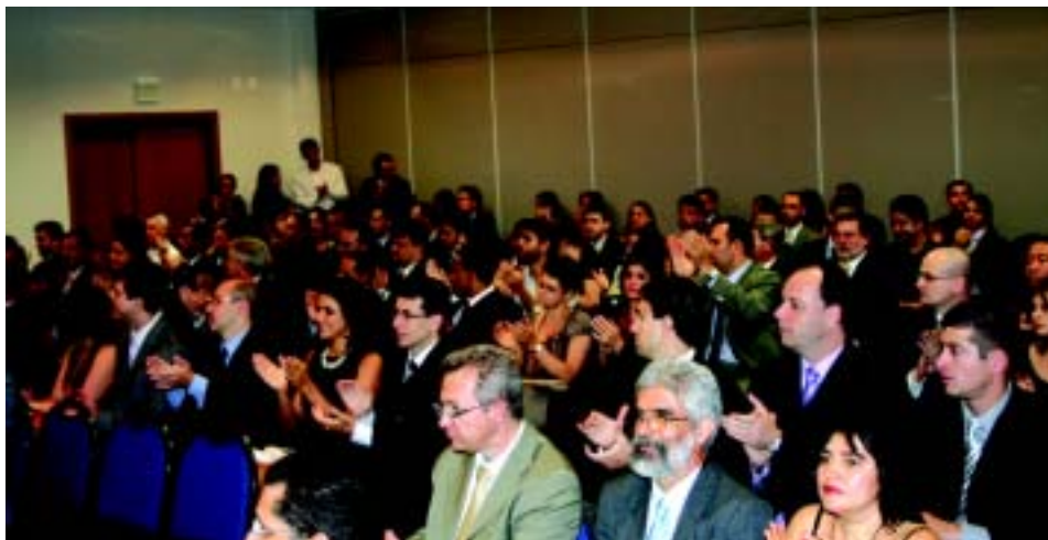
Evento histórico: ficou comprovado que "Unidos somos bem mais fortes" não é só uma frase