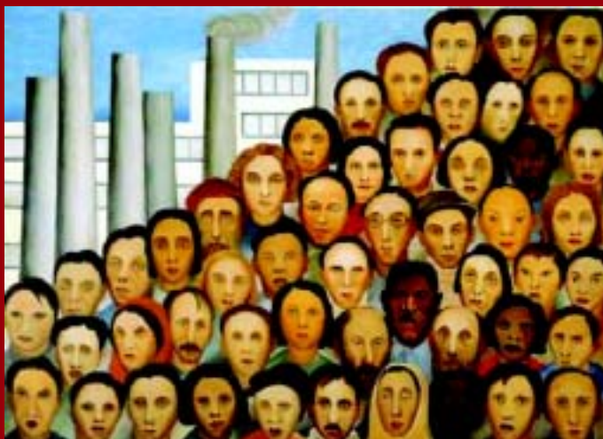
Operários, de Tarsila do Amaral