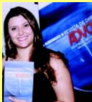
| Patrícia: o fruto de um sonho longo

O público que lê a Revista está nos tribunais, universidades e instituições jurídicas e associativas de todo o país. Em âmbito interno, a ADVOCEF providencia a divulgação dos assuntos da Revista que são pertinentes às atividades de cada área da CAIXA.