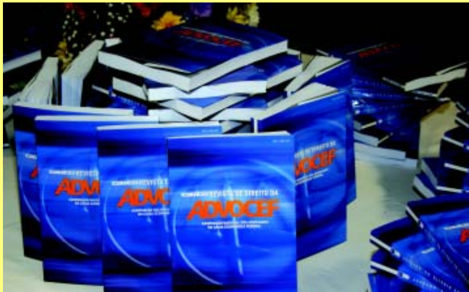
| A publicação da ADVOCEF está no Qualis, atestado de qualidade

Maia destaca a resposta recebida dos advogados e o orgulho de cada profissional pela existência da Revista. Endossa o que escreve a Diretoria na apresentação do volume: "Ao divulgarmos um tanto do que produzimos, descortinamos novos horizontes, firmando a certeza de que os