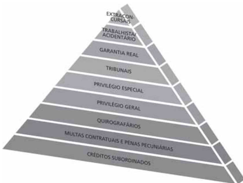
Figura 1 – Ordem de classificação dos créditos no âmbito da falência

A correta modelagem dessa estrutura é um desafio, pois, como dito, não parte de um protótipo já previsto em lei, como ocorre no concurso universal. Ao contrário, obriga o intérprete a pinçar, na legislação, cada peça que irá integrar tal estrutura e, em sua falta, com arrimo na doutrina e na jurisprudência.