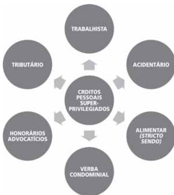
Figura 5 – Os créditos pessoais superprivilegiados mais comuns

As verbas constantes dos três patamares superiores da pirâmide representam os créditos superprivilegiados. Dessa maneira, o ápice da pirâmide é composto pelos créditos de natureza alimentar, quais sejam: a) crédito alimentar stricto sensu ; b) crédito trabalhista; c) crédito acidentário e d) honorários advocatícios, podendo o concurso, a depender do entendimento do magistrado, ser resolvido de forma conjunta e pro rata , em relação ao valor de cada quinhão, ou, ainda, privilegiar o crédito alimentar stricto sensu , em detrimento das demais verbas alimentares, eis que essas, ao contrário daquela, são derivadas do trabalho exercido por seu titular. Em seguida, constam dois outros créditos superprivilegiados nessa ordem: crédito tributário e crédito condominial. Em quarto lugar, surge o crédito amparado pelos direitos reais de garantia, lembrando que o valor do crédito que ultrapassar o valor do bem que o garante deve ser reclassificado como quirografário. Em seguida, é a vez dos créditos pessoais privilegiados – especial e geral –, conforme determinado pelo Código Civil e pela legislação especial. O crédito pessoal simples ou quirografário finaliza a ordem de classificação creditória no âmbito do concurso particular de credores, sendo certo que, nesse ponto, a ordem de vocação creditória passará a ser ditada pela legislação processual, eis que o êxito do credor irá depender da anterioridade da penhora que o aproveita.