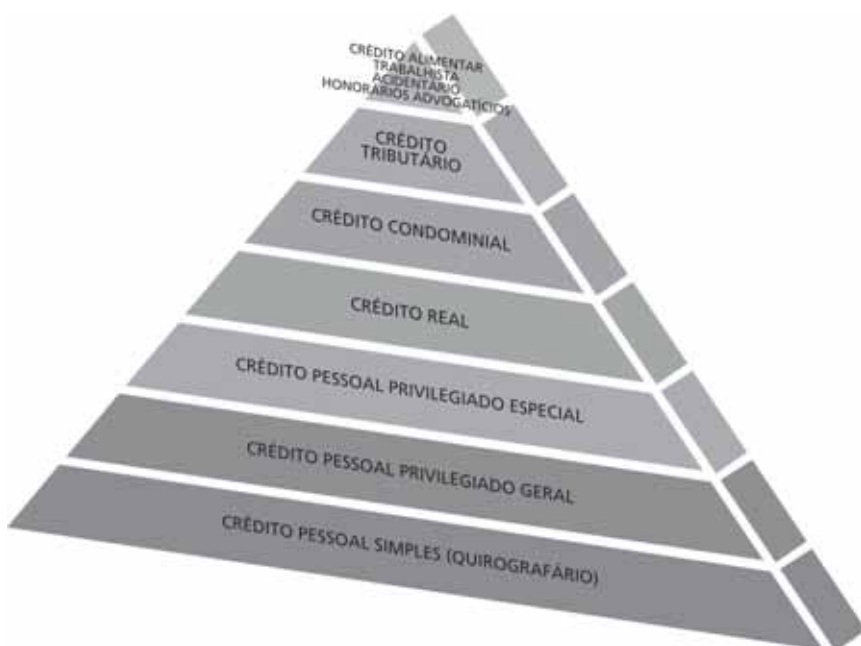
Figura 4 – Ordem de classificação dos créditos no concurso particular de credores

Em face das lições doutrinárias supra e das pesquisas efetuadas pelo autor, sugerimos a pirâmide a seguir como modelo para a correta distribuição do crédito no âmbito do concurso particular de credores, representando a ordem de vocação creditória à luz da legislação, doutrina e jurisprudência atuais: