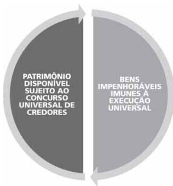
Figura 2 – A afetação genérica do patrimônio do devedor no âmbito do concurso universal de credores