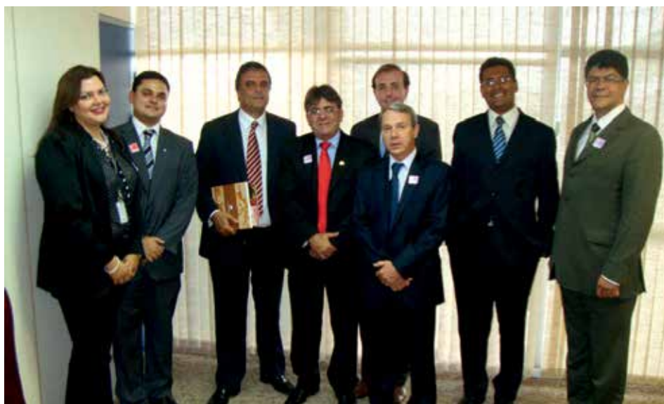
Reunião com o ministro da Justiça José Eduardo Cardozo, em 2012

Com a posse este ano do novo presidente do Conselho Federal da