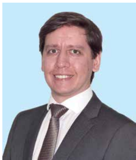
Felipe: período emblemático para a nação

“Um importante olhar do nosso órgão de classe para os anseios desta categoria tão especial e necessária para a incessante busca do interesse público nas empresas estatais do país, sejam municipais, estaduais ou federais.”