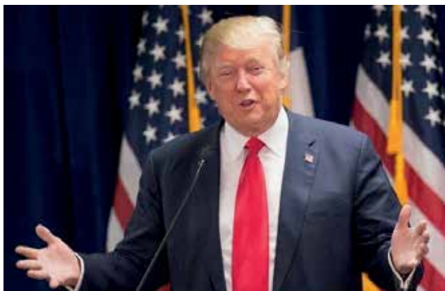
Presidente eleito dos EUA, Donald Trump

Há muito trabalho à vista para os advogados americanos, se forem cumpridas as promessas feitas pelo candidato eleito Donald Trump. Entre elas, acabar com a imigração ilegal, renegociar tratados internacionais e, entre outras tantas polêmicas, construir um muro na fronteira dos EUA com o México – e fazer o governo mexicano pagar por ele. “Vamos ver a advocacia em esteroides”, comentou o consultor jurídico americano Peter Zeughouser. (Fonte: Consultor Jurídico.)