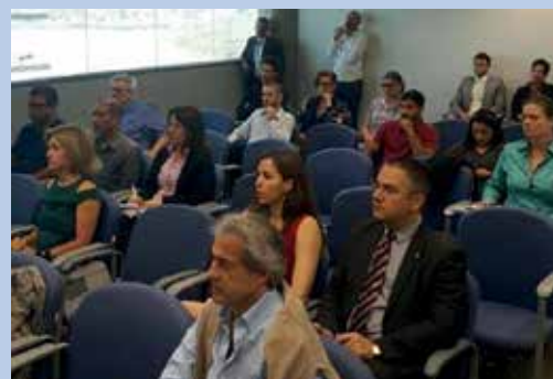
Evento discutiu o CPC em Florianópolis